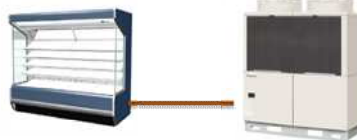
冷蔵・冷凍ショーケース